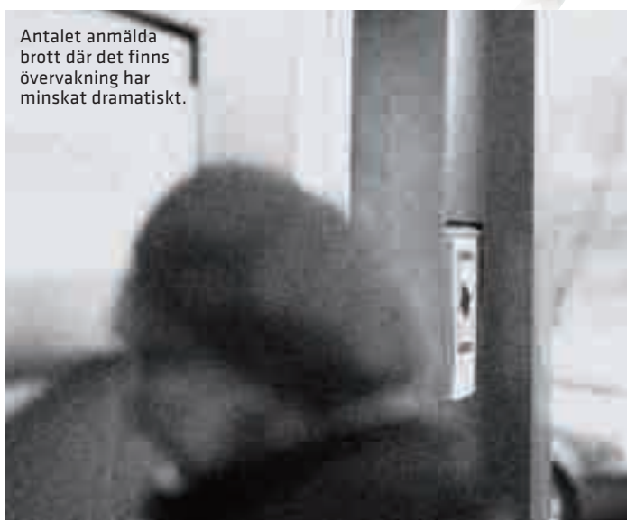
Antalet anmälda brott där det finns övervakning har minskat dramatiskt.